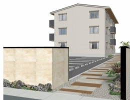
完成予想図につき実際とは多少異なる場合があります 掲載は実際の状態と異なる場合があります