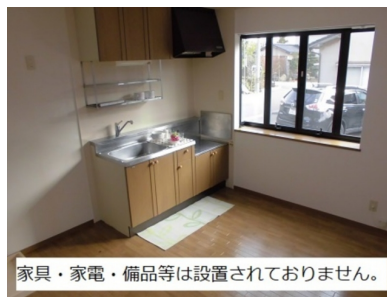
家具・家電・備品等は設置されておりません。