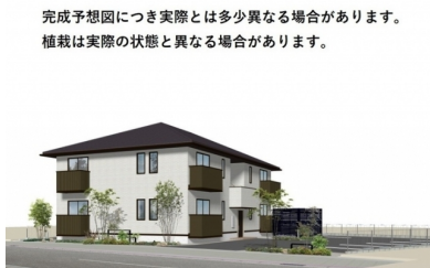
完成予想図につき実際とは多少異なる場合があります。植栽は実際の状態と異なる場合があります。